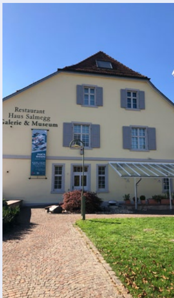
Haus Salmegg 10