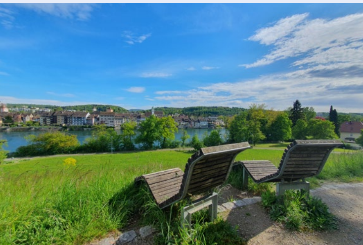
Sonnenliegen am Adelberg