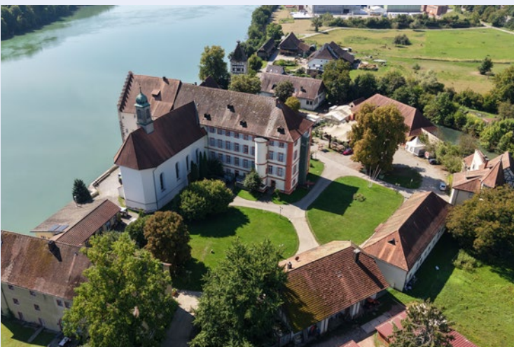
Schloss Beuggen 17